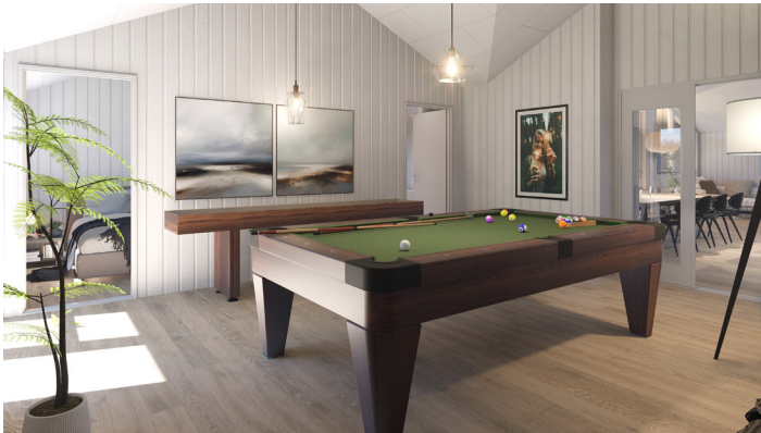
Anvendte billeder er 3D-visualiseringer – mindre afvigelser kan forekomme. Se flere her.